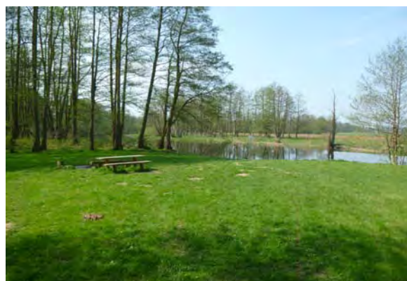
Besonder wertvoll ist die direkte Nähe zur Hansestadt Rostock und die touristisch nutzbare Warnowniederung mit der Burg Werle